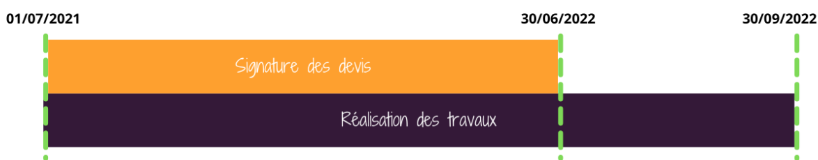
Fig 2. Dates limites d'engagements et de réalisation de travaux du futur dispositif CDP Isolation

A noter, les travaux réalisés dans le cadre de ce nouveau Coup de Pouce isolation devront être achevés au plus tard le 30/09/2022.