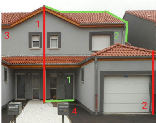
Cas n°1 : isolation en mitoyenneté